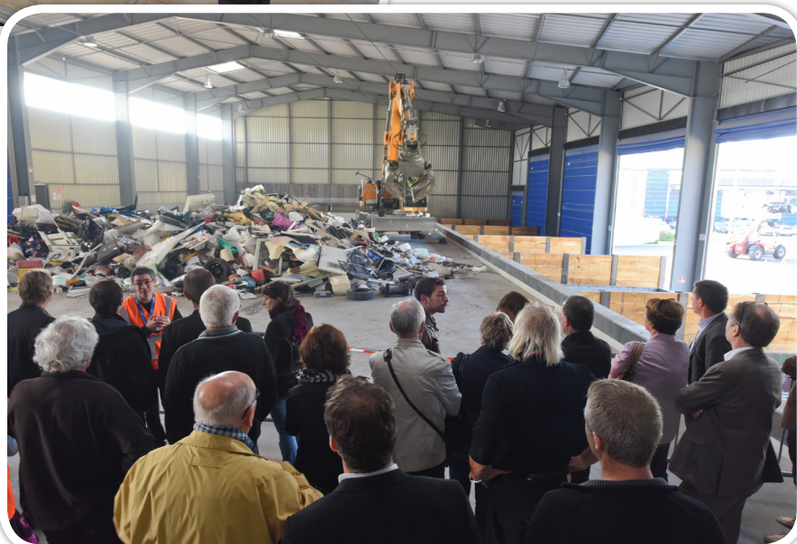
Inauguration de l'Installation Tri-Massification le 10 octobre 2015