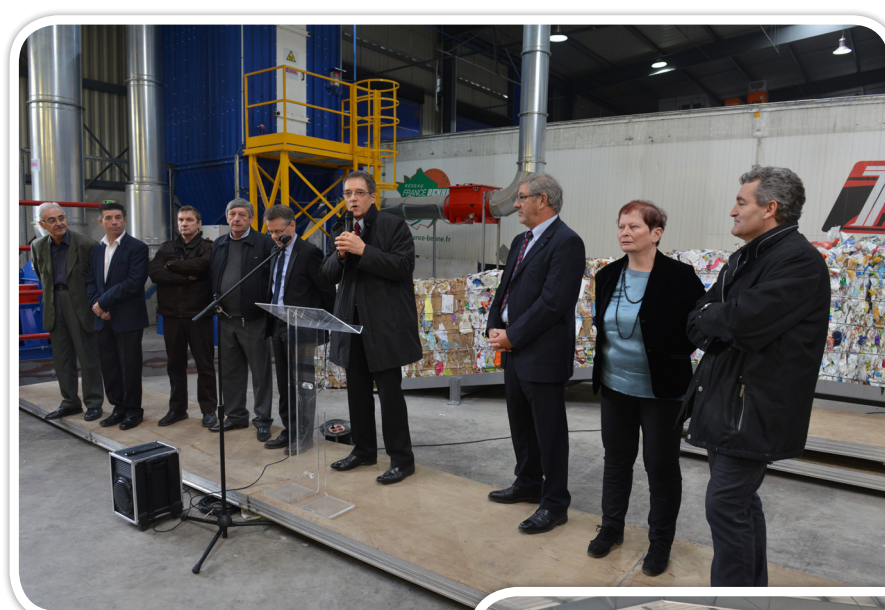
Inauguration du centre de tri des déchets le 24 novembre 2012